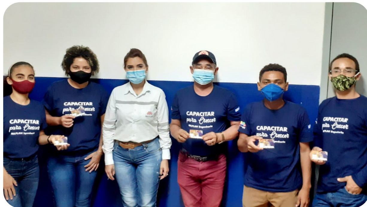
Cuidar, capacitar e transformar