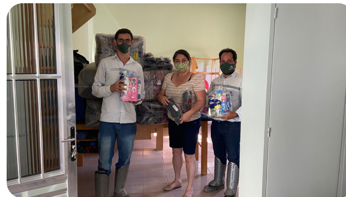
Santo Antônio do Grama