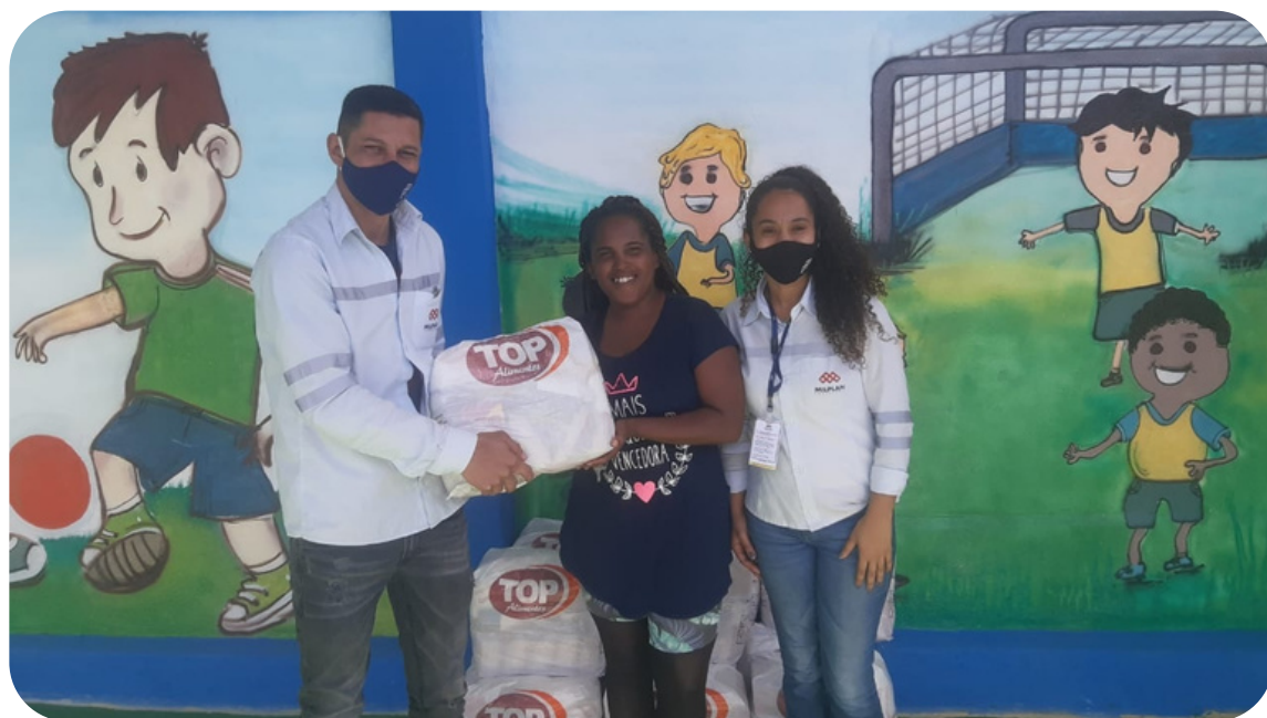
POSCRIS - M.424