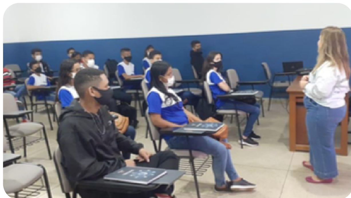
Programa Jovem Aprendiz