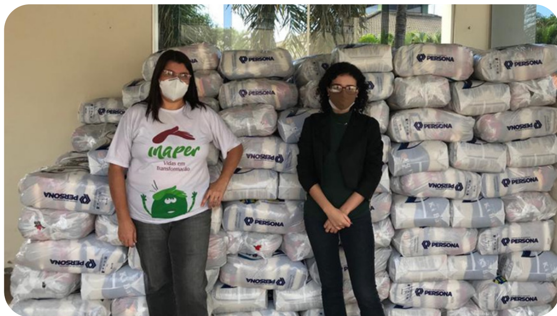
INAPER - SEDE