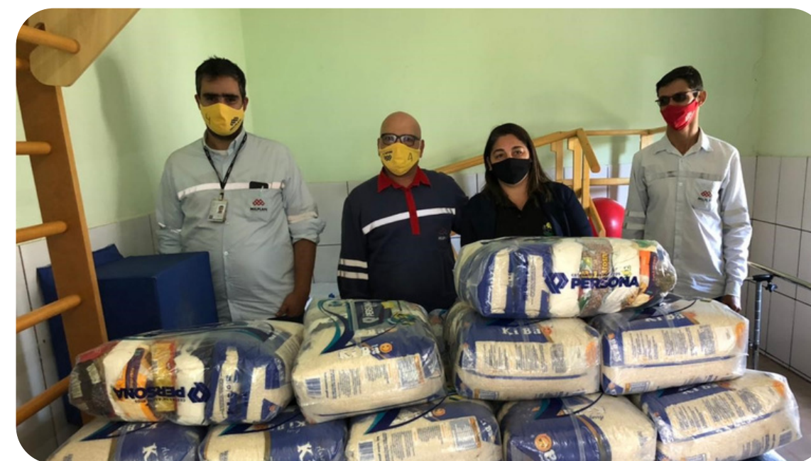
APAE - M.420