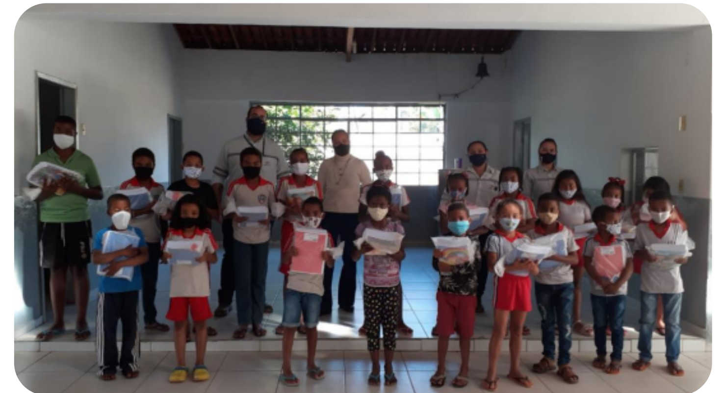
Conceição do Mato Dentro