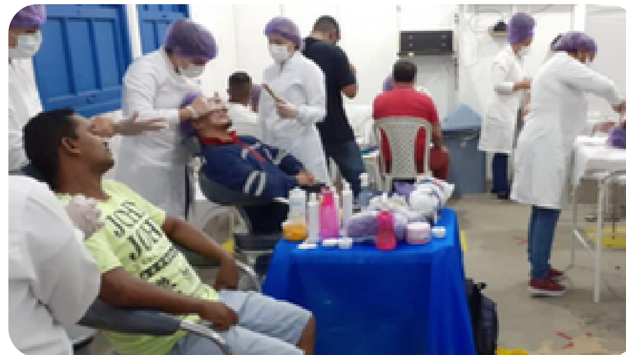
Cuidar, capacitar e transformar