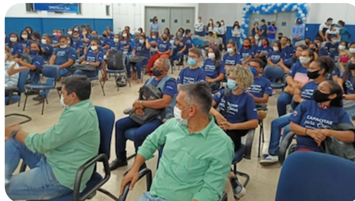
Capacitar para crescer