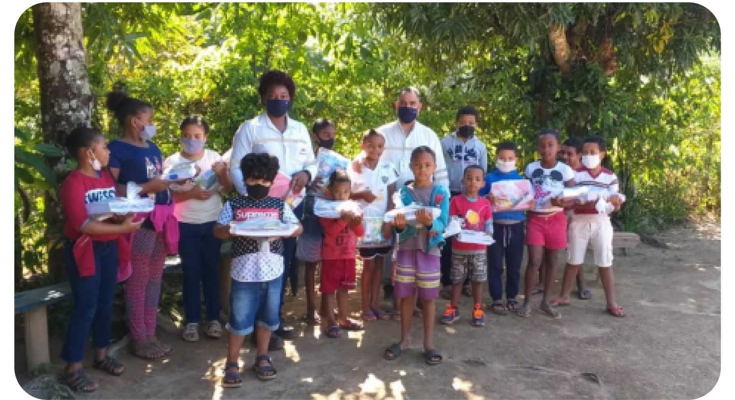
Conceição do Mato Dentro