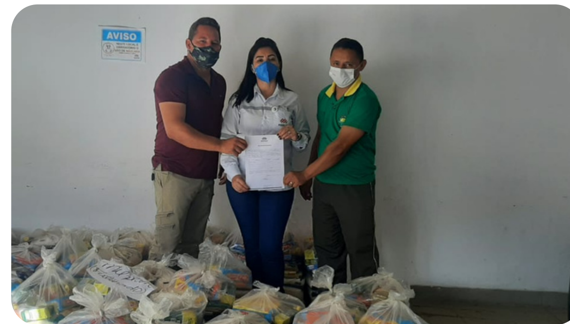
APROAPA - M.422