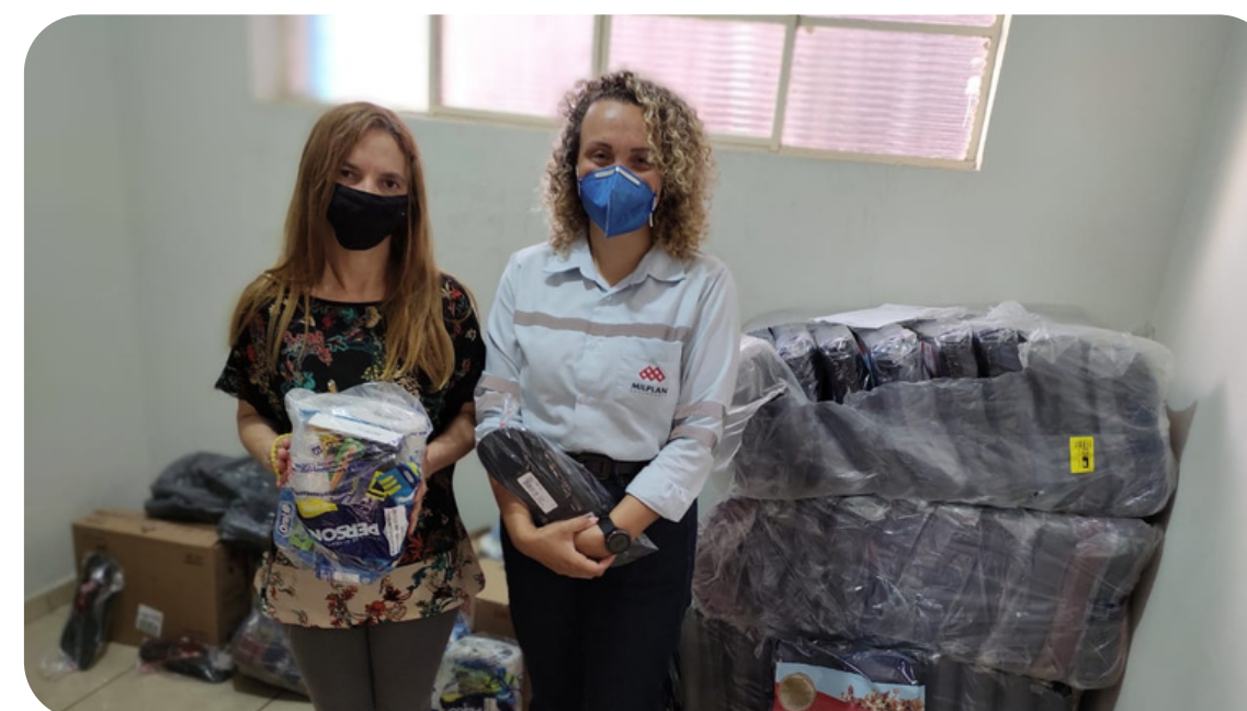
Barões de Cocais