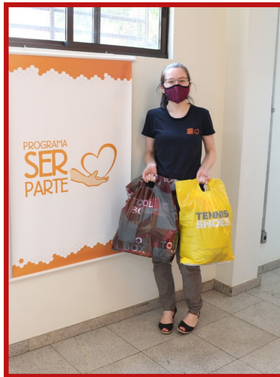
Projeto: SER PARTE